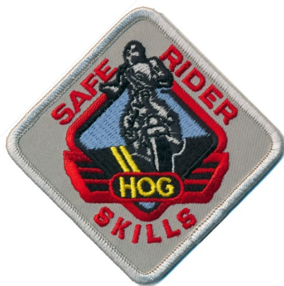
Patch für absolviertes Sicherheitstraining