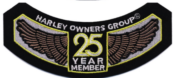
Patches für 10- bzw. 25-Jährige HOG-Mitgliedschaft